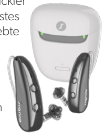
Pure Charge&Go IX

9 Jahre arbeiteten die Forscher und Entwickler in Erlangen an der neuen Plattform. Als erstes Produkt mit IX Plattform kommt der beliebte Alleskönner von Signia auf den Markt: Pure Charge&Go. Mit seiner kleinen Bauform ist das Pure diskret und robust, bietet aber dennoch hohen Komfort. Der eingebaute Hochleistungsakku schafft bis zu 34h inkl. 5h Streaming und ist für den Alltag selbst der aktivsten HörgeräteträgerInnen geeignet, sagt der Hörgerätehersteller.